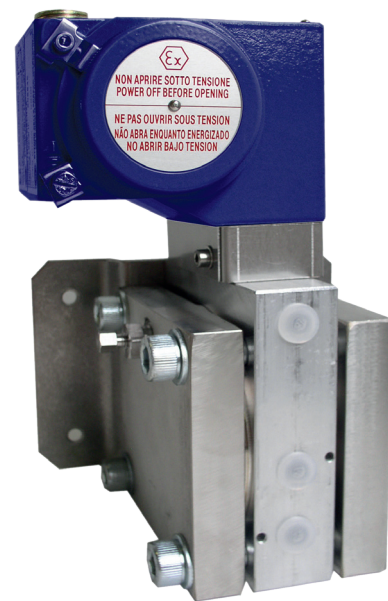
Переключатель дифференциального давления, модель DC

Для обеспечения максимальной гибкости эксплуатации переключатели дифференциального давления оснащены микропереключателями, допускающими непосредственную коммутацию электрических нагрузок до 250 В перем. тока, 10 А.